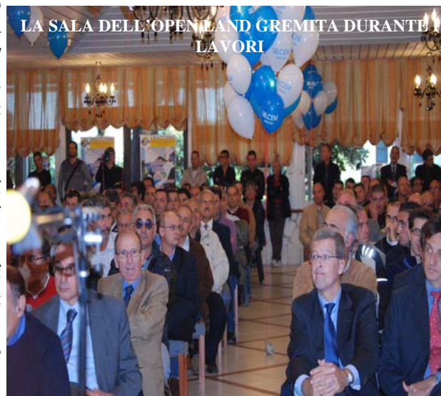
LA SALA DELL'OPENLAND GREMITA DURANTE I LAVORI

Ma abbiamo siglato anche accordi positivi con l'Isab Energy e con la Esso Augusta. Attuando queste iniziative, penso che abbiamo contribuito ad imprimere una nuova configura-