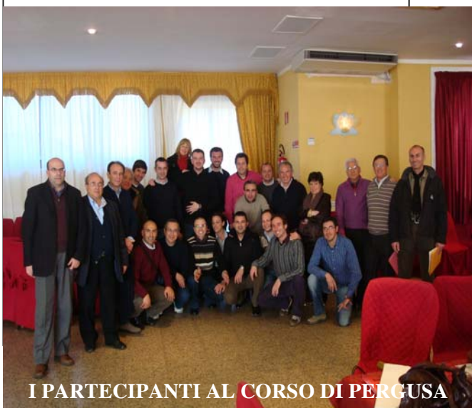
I PARTECIPANTI AL CORSO DI PERGUSA

L'avvio è stato dato il 17 e 18 marzo a Pergusa (Enna) con il primo dei due momenti formativi che interesseranno la Sicilia, l'altro è previsto per il 5 e 6 maggio, mentre il termine dei lavori avverrà a luglio, a quella data tutte le realtà territoriali avranno avuto l'opportunità di far crescere professionalmente i propri quadri dirigenti.